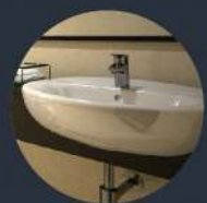
อ่างล้างหน้า ทรงมนกลม