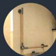
ราวจับทรงตัว