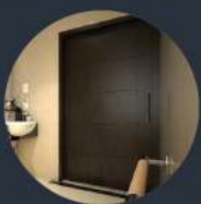
บานประตูเลื่อน แบบรางแขวน