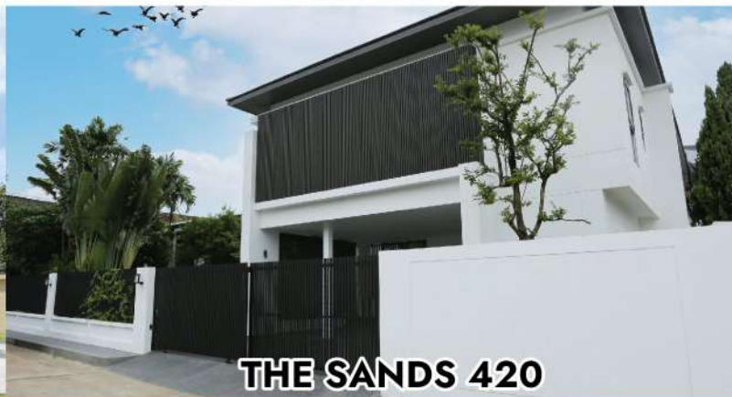
THE SANDS 420