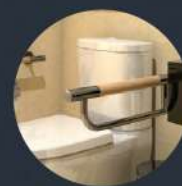
พนักแขนข้างโถ